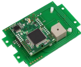
TWN4 OEM PCB Untenansicht