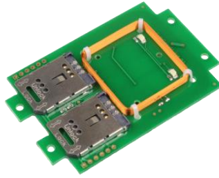
TWN4 OEM PCB Draufsicht