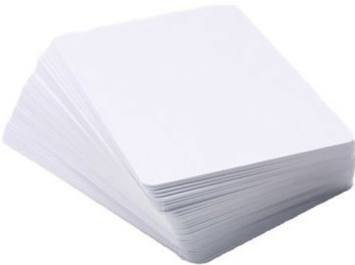
Plastik- und Chipkarten