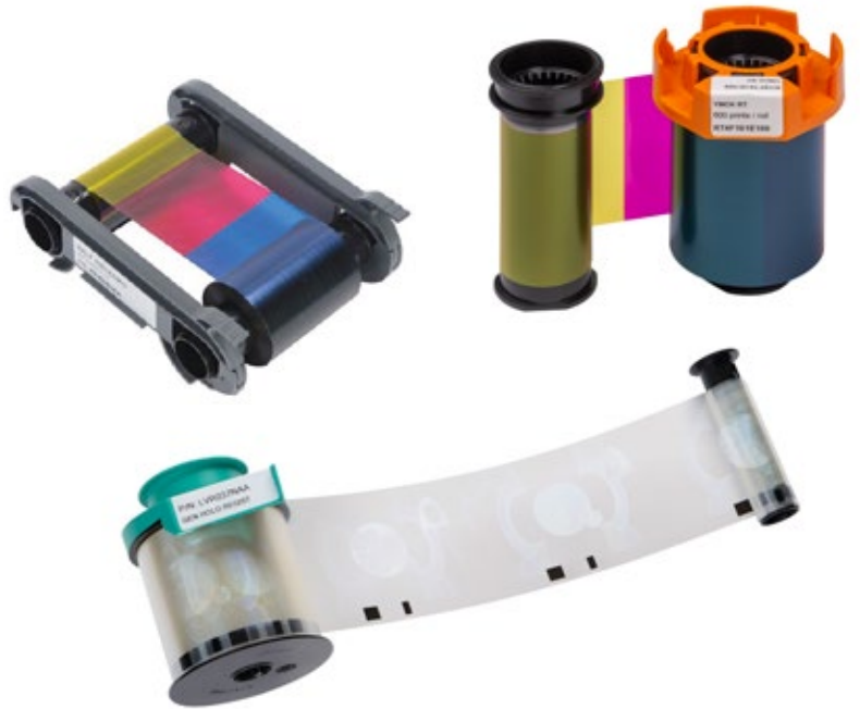
Farbbänder, Transferfolien und Lamine